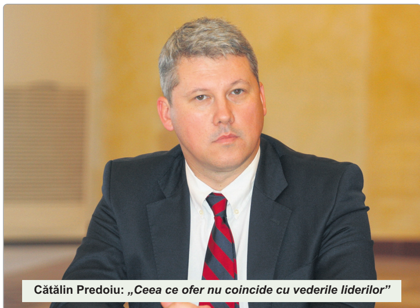
Cătălin Predoiu: „Ceea ce ofer nu coincide cu vederile liderilor”

S oc și groază! Liberalul Cătălin Predoiu nu mai candidează la șefia PNL. El a făcut marele anunț, marți seară, pe Facebook. Predoiu a afirmat că ceea ce are de oferit pentru funcția de președinte al PNL nu coincide cu viziunile liderilor de organizații. „În ultimele șase luni am efectuat un demers serios și am vizitat din nou o mare parte din organizațiile PNL. Am urmărit cu atenție preparativele Congresului și respectarea statutului pentru o competiție cinstită. Am înțeles, în același timp, că ceea ce