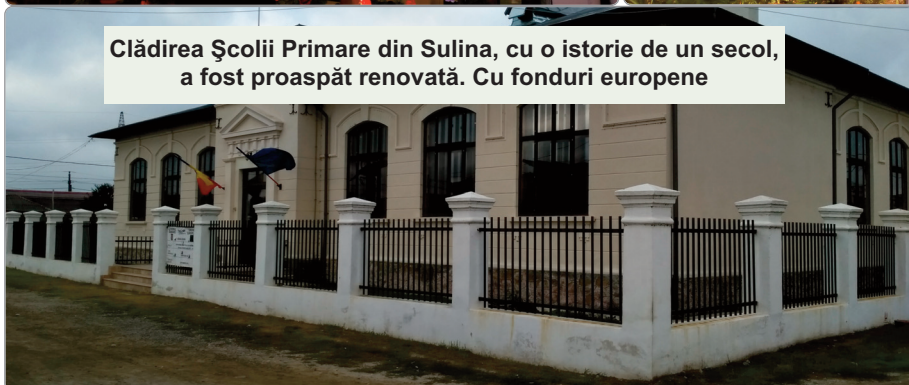
Clădirea Școlii Primare din Sulina, cu o istorie de un secol, a fost proaspăt renovată. Cu fonduri europene