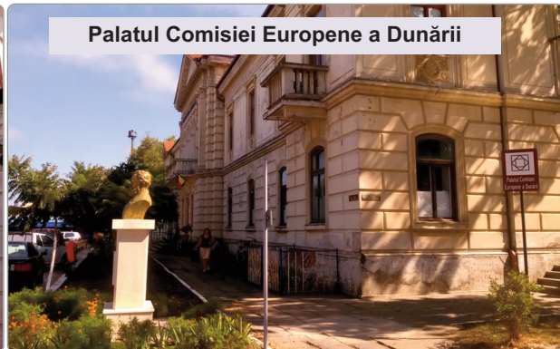
Palatul Comisiei Europene a Dunării