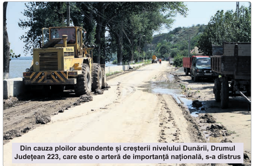
Din cauza ploilor abundente și creșterii nivelului Dunării, Drumul Județean 223, care este o arteră de importanță națională, s-a distrus

■ DIG LA DUNĂRE ■ Un alt drum județean care ar urma să intre în reabilitare în primăvara acestui an este DJ 223, care face legătura între comuna Ion Corvin și orașul Cernavodă. Este vorba despre acea arteră rutieră care leagă partea de nord de cea de sud a județului, de-a lungul Dunării, și care a devenit aproape impracticabilă în ultimii ani.