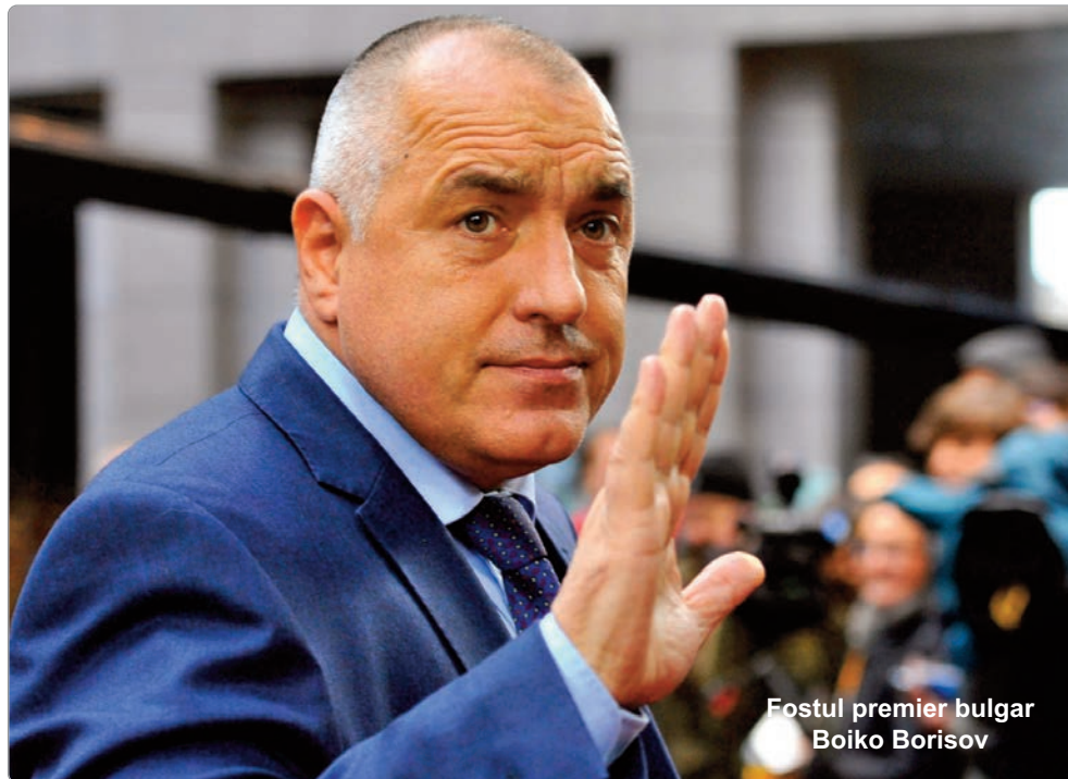
Fostul premier bulgar Boiko Borisov

Fostul premier bulgar Boiko Borisov, întărit de victoria partidului său conservator în fața socialiștilor la alegerile legislative de duminică, s-a lansat luni în căutarea de aliați pentru formarea unui guvern și pentru asigurarea unui al treilea mandat de prim-ministru sub semnul stabilității, transmite AFP. Rezultatele oficiale după numărarea a 94% din voturi arată că partidul lui Borisov, GERB, a obținut 32,6% din sufragii și 96 din cei 240 de aleși, mai mulți decât în Parlamentul actual (84). Această reușită este o surpriză fericită pentru Borisov, al cărui partid era cotate practic la egalitate cu socialiștii (PSB) în sondajele din ultimele săptămâni.