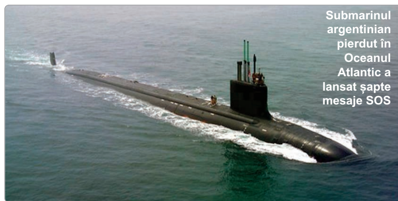
Submarinul argentinian pierdut în Oceanul Atlantic a lansat șapte mesaje SOS

Ministerul argentinian al Apărării a anunțat, duminică, faptul că au fost detectate semnale prin satelit transmise de la bordul submarinului militar