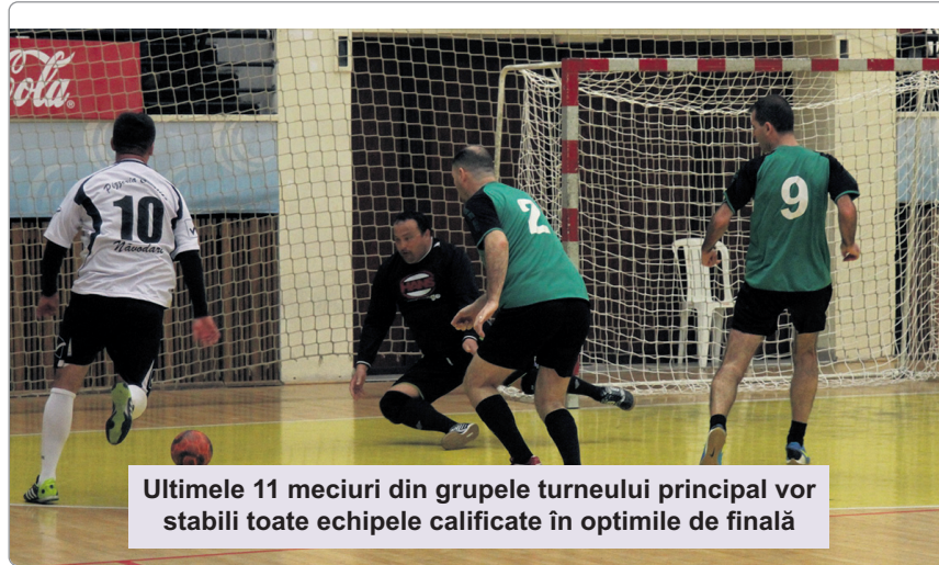
Ultimele 11 meciuri din grupele turneului principal vor stabili toate echipele calificate în optimile de finală

Turneul este organizat de cotidianul „Telegraf” și Asociația Județeană de Fotbal Constanța, în parteneriat cu Direcția Județeană pentru Sport și Tineret Constanța.