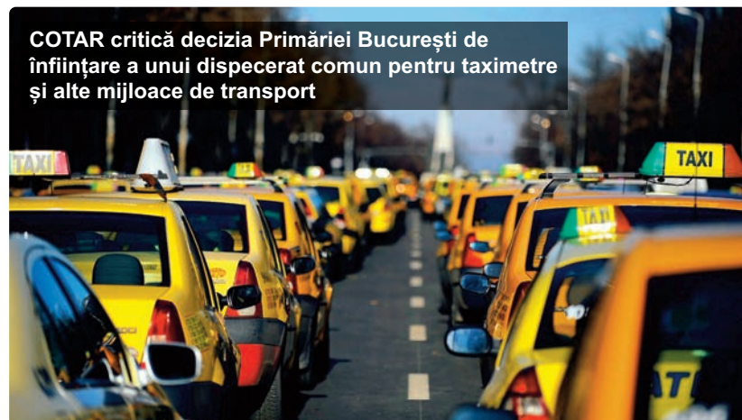
COTAR critică decizia Primăriei București de înființare a unui dispecerat comun pentru taximetre și alte mijloace de transport

Paul NĂȘĂUDEANU paul.nasaudeanu@telegrafonline.ro