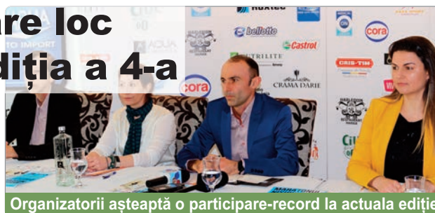
Organizatorii așteaptă o participare-record la actuala ediție

■ DE LA O SIMPLĂ ALERGARE PE PLAJĂ, LA UN FENOMEN