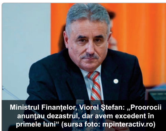
Ministrul Finanțelor, Viorel Ștefan: „Proorocii anunțau dezastrul, dar avem excedent în primele luni”

bugetare. Se fac săptămânal aceste rapoarte de progres, ne-am uitat la ultima analiză pe rezultatele finale pe primele două luni ale anului, vestea bună este că bugetul s-a închis pe două luni pe excedent, ce-i drept nu spectaculos, dar foarte important, pe excedent”, a declarat ministrul Finanțelor Publice. Viorel Ștefan a afirmat că așteaptă cu interes închiderea lunii martie - lună de referință pentru execuția bugetară. „O să avem o imagine clară despre trendul pe care ne-am așezat în