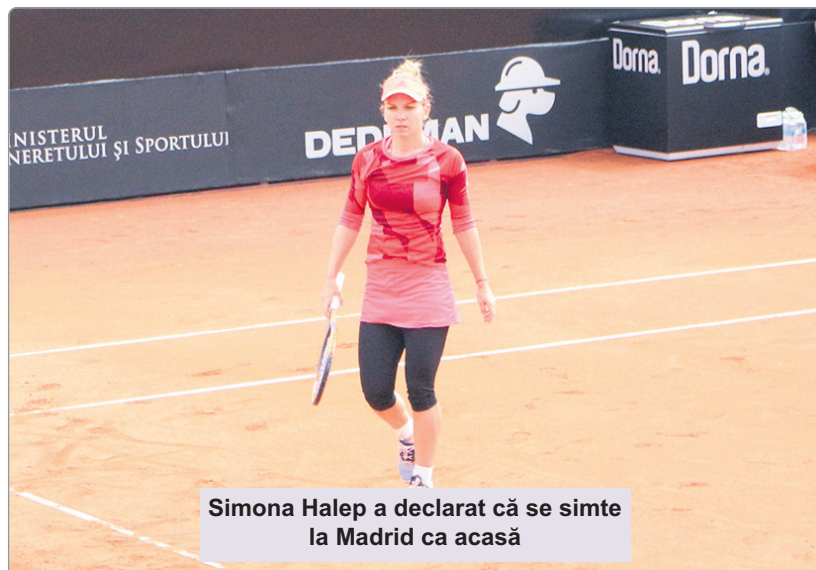
Simona Halep a declarat că se simte la Madrid ca acasă