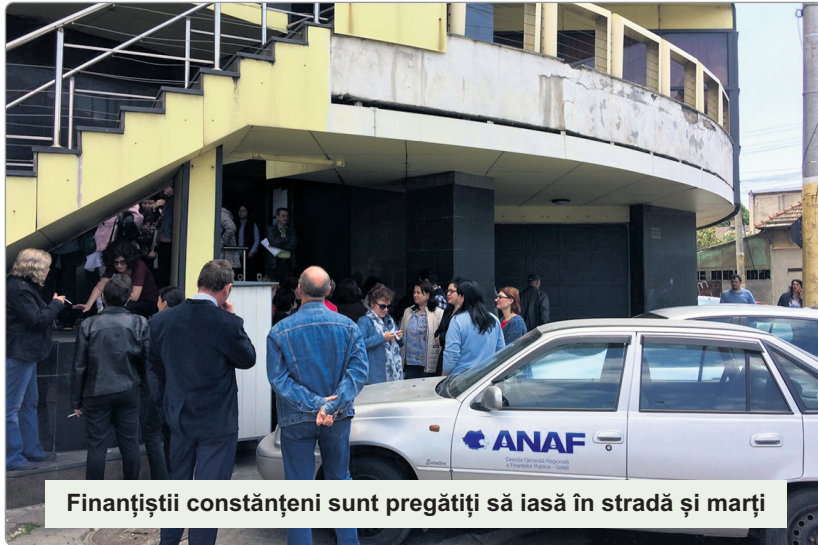
Finanțistii constănțeni sunt pregătiți să iasă în stradă și marți