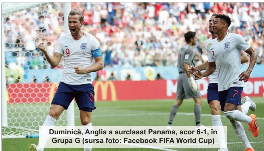
Duminică, Anglia a surclasat Panama, scor 6-1, în Grupa G

Turneul final al Campionatului Mondial de fotbal din Rusia a ajuns la partidele din ultima etapă din grupe, iar confruntările care vor stabili formațiile calificate în optimi se anunță deosebit de interesante. Se cunosc șase echipe care au scăpat de emoții, Rusia,