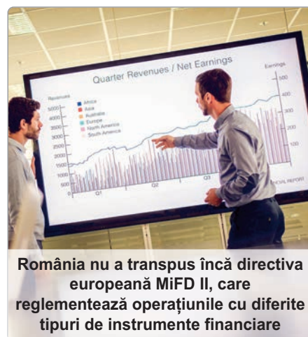
România nu a transpus încă directiva europeană MiFID II, care reglementează operațiunile cu diferite tipuri de instrumente financiare

derivate); în ceea ce privește piețele de instrumente financiare derivate pe mărfuri, legea prevede raportarea pozițiilor, precum și reducerea riscului