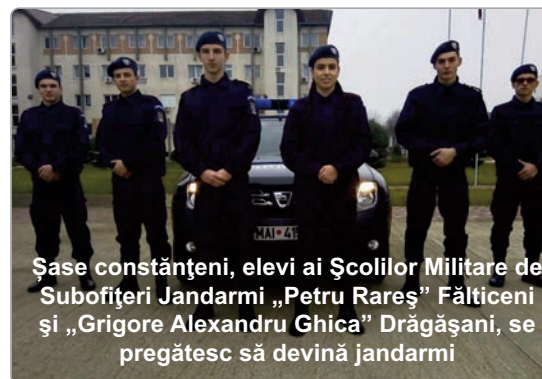
Șase constănțeni, elevi ai Școlilor Militare de Subofițeri Jandarmi „Petru Rareș” Fălticeni și „Grigore Alexandru Ghica” Drăgășani, se pregătesc să devină jandarmi

profesionalism pe parcursul întregii cariere”. Conducerea Inspectoratului de Jandarmi Constanța i-a asigurat pe tinerii subofițeri de tot sprijinul, i-a felicitat și le-a urat succes în