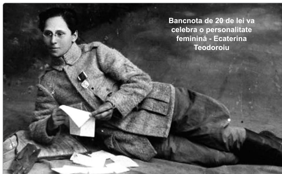
Bancnota de 20 de lei va celebra o personalitate feminină - Ecaterina Teodoroiu

Alegerea imaginii Ecaterinei Teodoroiu are o dublă semnificație. BNR susține astfel preocupările pentru consolidarea egalității de gen, în linie cu inițiativele altor bănci centrale din lume. De asemenea, BNR marchează încă o dată împlinirea Centenarului