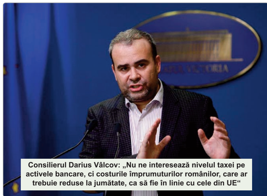
Consilierul Darius Vâlcov: „Nu ne interesează nivelul taxei pe activele bancare, ci costurile împrumuturilor românilor, care ar trebuie reduse la jumătate, ca să fie în linie cu cele din UE“

„Nu ne interesează nivelul taxei sau veniturile suplimentare, ci costul cu împrumuturile, care ar trebui să fie apropiat de cele ale restului europenilor, adică să fie redus la jumătate față de nivelul actual”, a conchis Vâlcov.