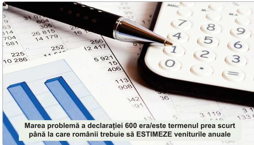
Marea problemă a declarației 600 era/este termenul prea scurt până la care românii trebuie să ESTIMEZE veniturile anuale