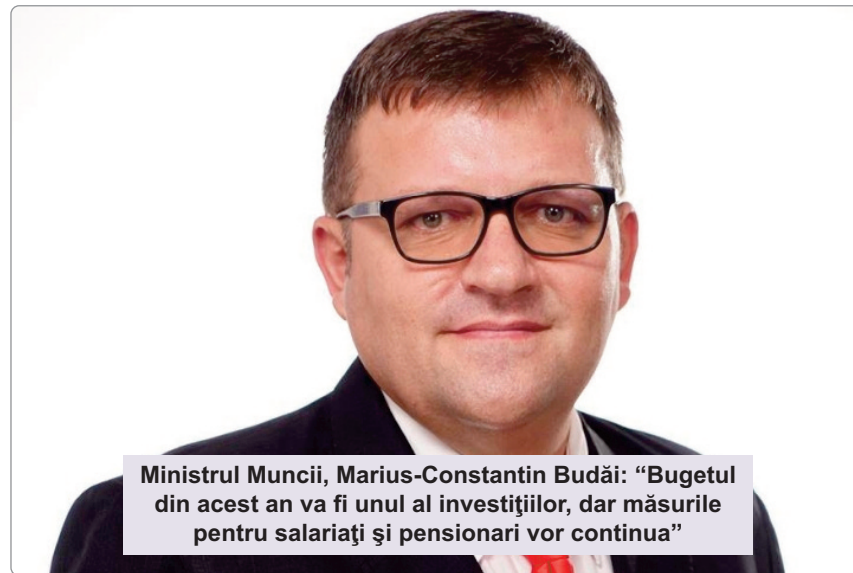
Ministrul Muncii, Marius-Constantin Budăi: „Bugetul din acest an va fi unul al investițiilor, dar măsurile pentru salariați și pensionari vor continua“

B ugetul din acest an va fi unul al investițiilor, dar măsurile pentru salariați și pensionari vor continua, a declarat, duminică seara, la România TV, ministrul Muncii, Marius-Constantin Budăi. „Va fi într-adevăr un buget al investițiilor, un buget al investițiilor la nivel național, dar și un buget al investițiilor la nivel local, prin continuarea acelui program de dezvoltare locală. Dar măsurile pentru salariați și pensionari vor continua, așa cum am spus, și am prezentat tot timpul”, a afirmat Budăi. Întrebat dacă vor fi bani pentru pensii și salarii și pentru majorarea acestora, ministrul Muncii a subliniat că a avut duminică dimineața o întâlnire cu ministrul Finanțelor, când s-a recalculat totul, pentru a se asigura că nu vor fi sincope. „De dimineață am mai avut o întâlnire cu specialiști din cadrul Ministerului Muncii și Ministerului Finanțelor și, împreună cu ministrul Finanțelor, Eugen Teodorovici, am reluat amândoi hârtiile, am recalculat, am vrut să ne asigurăm... Am spus de multe ori: noi măsurăm de zece ori și tăiem o dată. Și, clar, ne-am liniștit pe această speță. Adică referitor la tot ce înseamnă indemnizații ale persoanelor cu handicap, tot ce