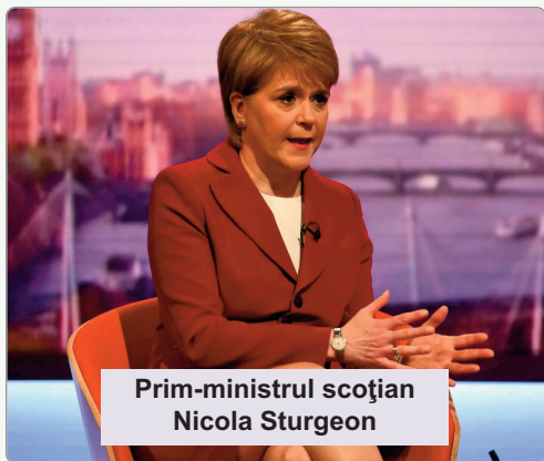
Prim-ministrul scoțian Nicola Sturgeon

Prim-ministrul scoțian Nicola Sturgeon a declarat miercuri că ieșirea Marii Britanii din Uniunea Europeană pune în pericol atât economia Scoției, cât și a întregului Regat Unit, astfel că nu va bloca organizarea unui