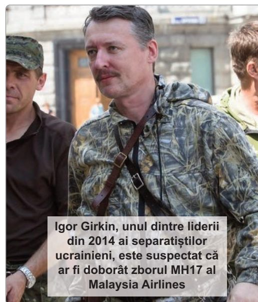
Igor Girkin, unul dintre liderii din 2014 ai separatiștilor ucrainieni, este suspectat că ar fi doborât zborul MH17 al Malaysia Airlines

Echipa internațională de anchetatori care investighează doborârea de către o rachetă rusă a zborului MH17 al companiei Malaysia Airlines deasupra estului separatist al Ucrainei în 2014 a făcut publice miercuri numele a patru suspecți, relatează DPA și AFP. Suspecții sunt considerați responsabili că au adus un sistem antiaerian de rachete Buk din Rusia în zona de conflict din estul Ucrainei, a declarat presei echipa de investigație, condusă de Olanda. Sistemul de rachete a provenit de la armata rusă și a fost folosit pentru a doborî avionul deasupra unei zone controlate de rebelii susținuți de