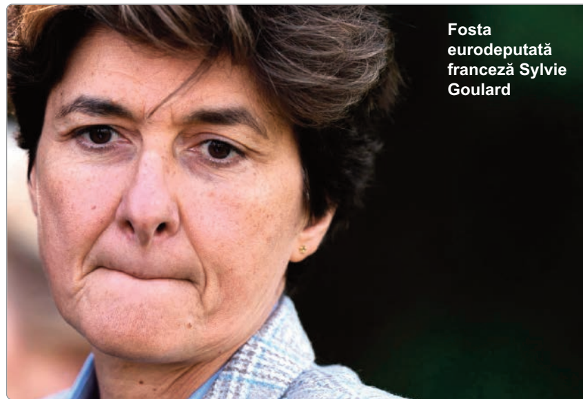
Fosta eurodeputată franceză Sylvie Goulard

Fosta eurodeputată franceză Sylvie Goulard, ce fusese inițial propusă de președintele Franței, Emmanuel Macron, pentru postul de comisar european în noul executiv comunitar, a fost inculpată vineri pentru presupuse angajări fictive ale unor asistenți de eurodeputați. Sylvie Goulard, care nu a fost numită în noua Comisie Europeană din cauza acestei anchete, a fost inculpată pentru deturnare de