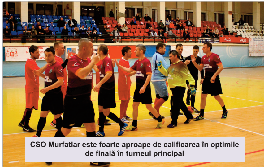
CSO Murfatlar este foarte aproape de calificarea în optimile de finală în turneul principal

cotidianul „Telegraf”, cu sprijinul Asociației Județene de Fotbal Constanța, în parteneriat cu Direcția Județeană pentru Sport și Tineret Constanța.