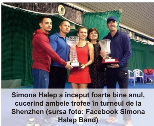
Simona Halep a început foarte bine anul, cucerind ambele trofee în turneul de la Shenzhen