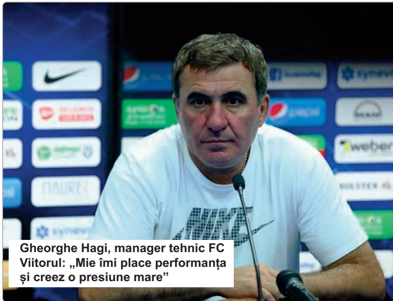
Gheorghe Hagi, manager tehnic FC Viitorul: „Mie îmi place performanța și creez o presiune mare”

După încheierea partidei de pe teren propriu cu FCSB, scor 1-4, disputată duminică seară, managerul tehnic al Viitorului, Gheorghe Hagi, s-a arătat, din nou, deranjat de modul în care sunt dezbătute de un grup din mass-media declarațiile sale. La conferința de presă la care a participat la finalul meciului din etapa a 6-a din Liga 1, Gică Hagi a fost extrem de nemulțumit pentru faptul că unele răspunsuri ale tehnicianului Viitorului sunt interpretate astfel încât să nască polemici: „Titluri și atacuri, nu mai știu cum să mă facă să fiu hulit. De ce? Eu mă întreb: ce le-am făcut? Pe vremea când am jucat i-am făcut fericiți. Din când în când îmi mai dau cu părerea. Opinia lui Hagi. Care a jucat fotbal. Care antrenează, care a investit în tineri, care a făcut ce n-a făcut nimeni. A investit în fotbalul românesc. Cum a zis Răzvan Lucescu acum câțiva ani, dar nu-l credeam, și m-am mirat, despre fotbalul nostru, că a ajuns în lumea a treia. Nu. nu... Cred că suntem în lumea a patra. Am ajuns în lumea a patra. Eu nu am dus fotbalul românesc aici. Am încercat să fac bine, nu rău, chiar dacă știu că și eu am greșit. Și eu sunt om. O să vedeți domnilor că în 2022 unsprezece o să am în echipa națională. Chiar dacă vorbiți rău de ei. Pentru că eu am muncit