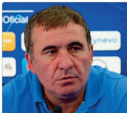
Gheorghe Hagi, manager tehnic Viitorul: „Diversiune pentru mine înseamnă mediocritate”

acolo, nu știu cât timp. Dar sunt foarte mulți care vor România iar acolo sus. Să găsească motivele pentru care fotbalul