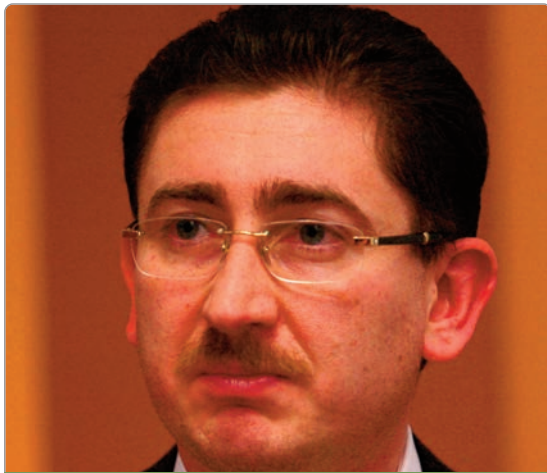
Șeful CC, Bogdan Chirițoiu: „2019 va fi un an agitat și confuz. Ne temem de scumpiri nejustificate în sectoarele impactate de ordonanța lăcomiei”

Prețurile în sectoarele economice vizate de OUG 114/2018 ar putea crește, ca urmare a noilor taxe, însă Consiliul Concurenței monitorizează aceste piețe pentru ca scumpirile să nu fie excesive, acesta fiind principalul risc în acest an, a declarat, marți, președintele instituției, Bogdan Chirițoiu - „Când am avut discuția privind riscurile pe care le vedem în 2019, am spus că aici trebuie să fim foarte atenți: la sectoarele impactate de ordonanța anti-lăcomie. Deci, monitorizăm piața, temându-ne de creșteri excesive de preț, nejustificate”. Consiliul Concurenței a aplicat sancțiuni în valoare totală de 435 milioane lei (93 milioane euro) în 2018, acesta fiind al doilea an cu cele mai mari amenzi din istoria instituției. Comparativ, în 2017 au fost acordate amenzi de 123 milioane lei. „A fost un an cu o activitate foarte intensă, al doilea ca nivel al sancțiunilor din istoria CC, cu 93 milioane euro sancțiuni totale, cu un succes în zona de ajutor de stat - cazul